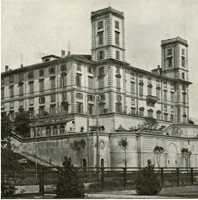
Figura 1. Ospedale psichiatrico provinciale di Milano in Mombello: facciata

derna avrebbe dovuto rispondere all'esigenza di controllo del variegato mondo delle masse di poveri e marginali.