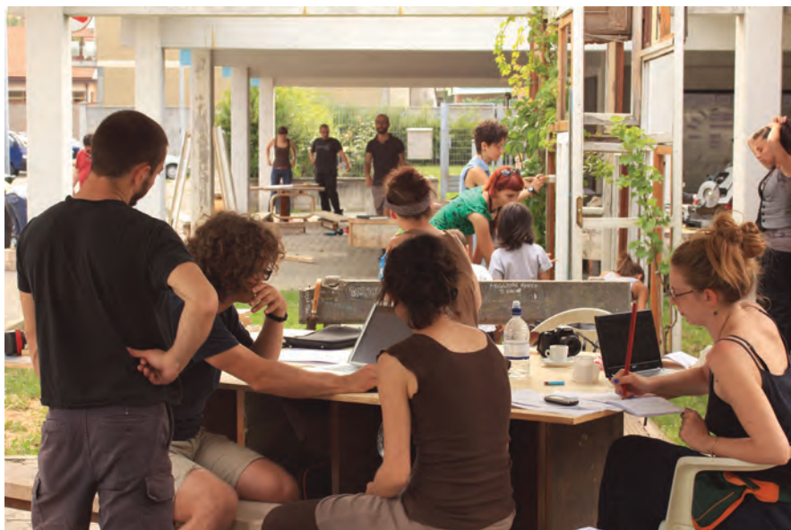
Figura 3. Raumlabor, Cantiere Barca, Torino, 2012