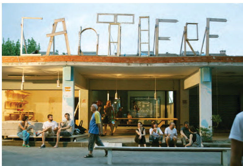
Figura 1. Raumlabor, Cantiere Barca, Torino, 2012

Nouveaux commanditaires è un protocollo di produzione di opere d'arte per lo spazio pubblico commissionate direttamente dai cittadini per i propri luoghi di vita o di lavoro. Dal 1992 a oggi sono circa 400 le opere realizzate in Europa secondo questo approccio progettuale, ideato dall'artista François Hers e attivato per la prima volta in Francia con il sostegno della Fondation de France, allo scopo di ripensare il rapporto tra l'arte e la società e il suo ruolo nei processi di partecipazione democratica e produzione di bene comune. Diffuso in altri paesi europei, Nouveaux commanditaires ha dato vita a una forma di «arte pubblica» che agisce sulla qualità degli spazi urbani, la loro capacità di rispecchiare significati e valori scaturiti dalla necessità espressiva delle comunità degli abitanti, contribuendo a facilitare l'iniziativa civica e le esperienze di federazione e azione comune degli abitanti. I «nuovi committenti» sono cittadini, singoli o in gruppo, che scelgono di affidare agli artisti la risposta a un desiderio o a un bisogno di trasformazione dei luoghi e dei contesti del proprio vissuto, rivolgendosi a esperti d'arte nel ruolo di «mediatori». I tre attori che prendono parte al progetto – cittadini=committenti, esperti d'arte=mediatori, artisti – sono dunque legati da un'attività di collaborazione temporanea finalizzata alla realizzazione dell'opera. Il ruolo dei mediatori è