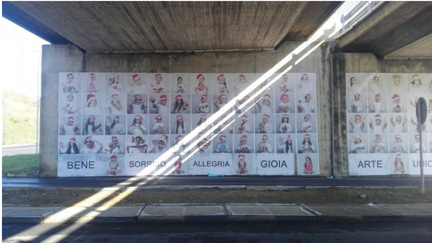
Figura 3 – Catania: il “Portale dell’identità” a cura di Antonio Presti (2016)

lezza non è Anti, ma è Altro. Ho visto le primavere siciliane diventare presto freddi inverni. Oggi dico che quelle primavere sono state delle passerelle. Le nuove generazioni devono sapere che la rivoluzione passa dalla conoscenza. La bellezza, quando si esprime, non è mai anti».