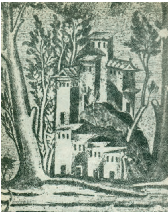
Figura 1. Il castrum, casale fortificato, centro di riorganizzazione del paesaggio agrario nell'Italia longobarda e bizantina, in un mosaico della Moschea degli Ommiadi, a Damasco.

In conclusione, la definizione che oggi possiamo dare di borgo ha a che fare con ciò che il paesaggio e i paesi fortificati che abbiamo davanti evocano, oltre che con elementi architettonici e non si può dare per scontato che gli stessi venissero chiamati borghi in passato. La definizione data dall'Associazione dei Borghi più belli d'Italia, inoltre, è figlia del proprio tempo, in quanto, oltre a stabilire termini architettonici assolutamente utili a identificare ciò che oggi si intende per borgo, rimanda anche alla ricerca di un'autenticità e di una tipicità connesse alle fantasie dei viaggiatori contemporanei, che collegano ad un Medioevo immaginato le radici di ciò che assaporano e sperimentano oggi nelle terre costellate dai numerosi borghi italiani.