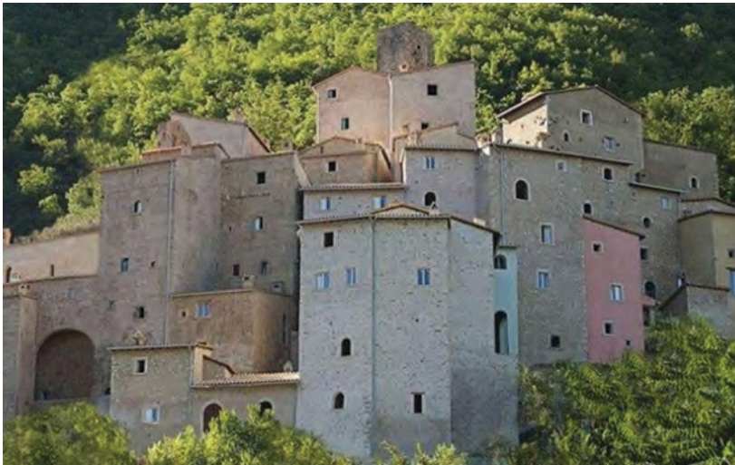
Figura 2. Il borgo di Postignano

L'esempio di Postignano, dunque, rende l'idea di come "borgo", oggi, sia una parola che non parla più solo di mura difensive, case di pietra, colline e Medioevo; questo termine è diventato un'etichetta, un simbolo il cui significato racchiude non più le funzioni e la vita dei suoi abitanti originari, bensì il loro ricordo, con tutte le suggestioni che porta con sé. La sua funzione, dunque, è cambiata alla radice: ricordare, creare un ponte con l'autentico, aprire una finestra su un altrove rurale fatto di tradizioni, comunità, lentezza, ma anche «isolamento» e «raccoglimento», come alcuni intervistati hanno sostenuto.