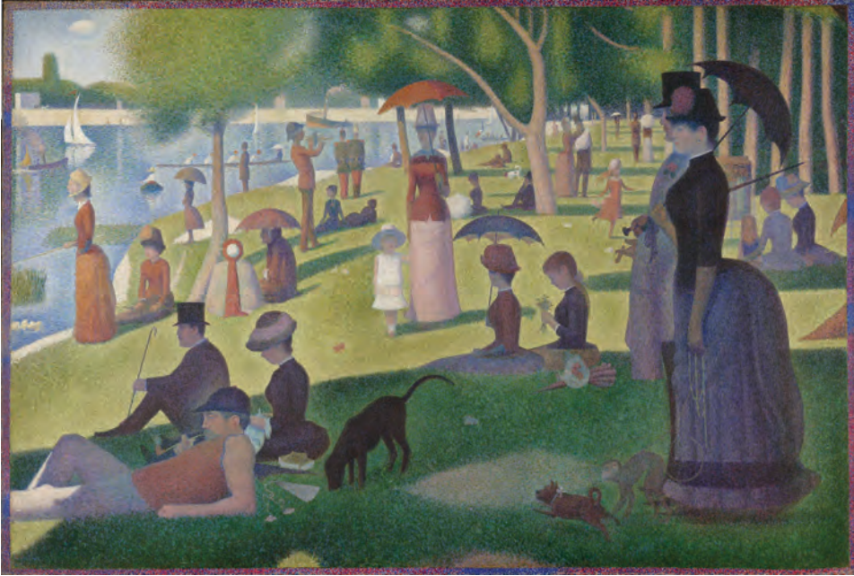
Figura 1. Una domenica pomeriggio sull'isola della Grande-Jatte, opera di G. Seurat, 1884-86 (Fonte: The Art Institute of Chicago – Google Arts&Culture)

Una seconda fase si apre a seguito delle due guerre mondiali quando nelle città, liberate dall'oppressione dei conflitti, aumenta la domanda di benessere sociale di cui il tempo libero ne costituisce una dimensione importante (Colleoni 2014: 76 e ss.). In questo periodo si afferma un rinnovato interesse per i giardini e per i parchi pubblici in quanto luoghi ove è possibile svolgere attività di svago all'aperto, aspetto che ne costituisce un importante valore aggiunto.