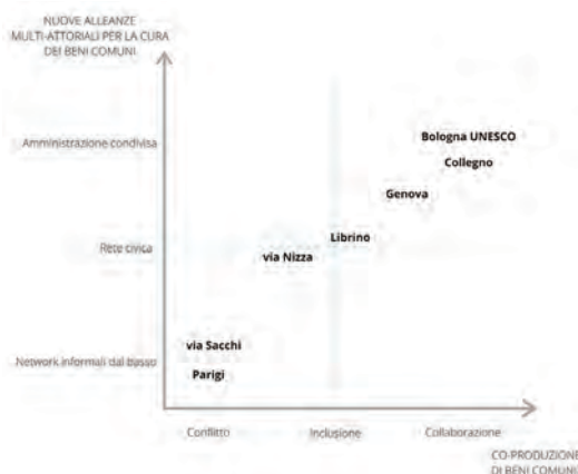
Figura 1 – I casi studio sono stati disposti secondo una matrice valutativa che indica sull'asse verticale “nuove alleanze multi-attoriali per la cura dei beni comuni” e su quello orizzontale il livello di “co-produzione di beni comuni” (elaborazione delle autrici)