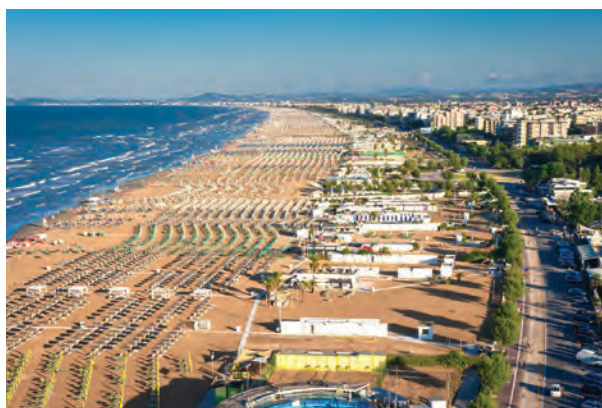
Figura 2. La spiaggia della Riviera Romagnola oggi, da Rimini a Gabicce Mare