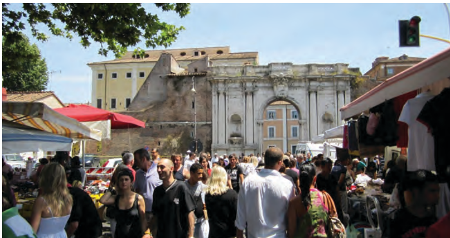
Figura 5. Roma: l'ingresso principale del mercato domenicale di Porta Portese

La mancanza di un approccio al sociale per rispondere a bisogni concreti sempre più emergenti e diffusi ha progressivamente provocato una dismissione dello spazio collettivo. Non soltanto per via di una conversione ai diktat del turismo «mordi e fuggi», Roma da tempo è un sistema di scatole cinesi che, in assenza o in attesa di stabilire adeguate relazioni comunicative, si prevaricano a vicenda e mettono in atto una restrizione della civitas , ovvero dismettono significati, sentimenti e aspirazioni collettive capaci di assegnare un senso allo spazio e alla ricerca di stili di vita.