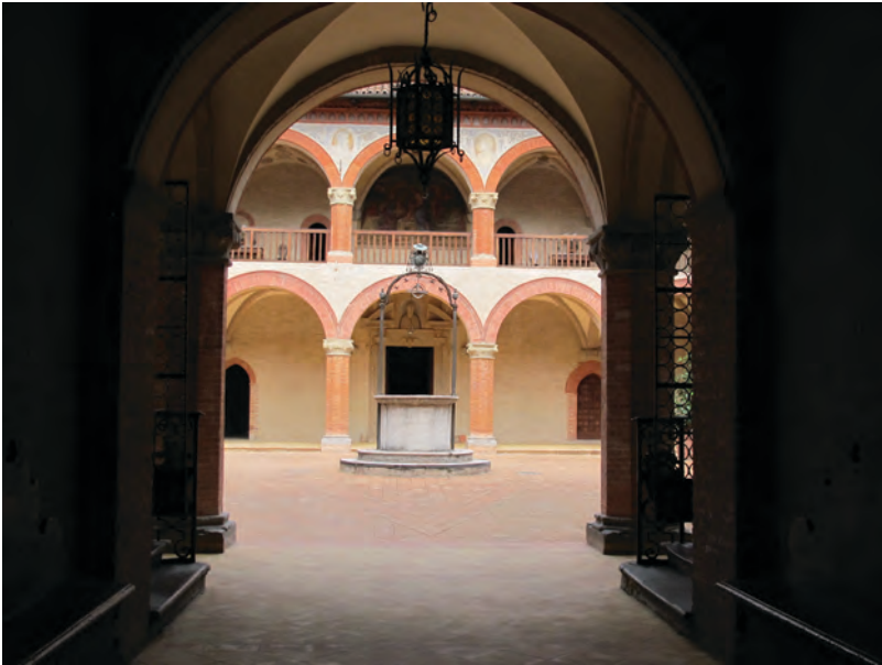
Figura 1. Il Collegio di Spagna a Bologna

Per un paio di secoli la residenzialità universitaria rimane relativamente decentrata e plurale, basata su specifiche forme di mecenatismo e su soluzioni locali. A partire dal XVI secolo, invece, almeno nell'Europa cattolica, si affacciano forme di controllo ecclesiastico più sostanziale: le conseguenze del Concilio di Trento (1542-1563) evidenziano tentativi egemonici della riforma cattolica, che si concretizzano soprattutto nei collegi e nelle università gesuite fra il XVI e il XVII secolo (Brizzi 1996). Gli impianti costruttivi e organizzativi diventano più omogenei, organizzati per corti dedicate alle singole funzioni. A partire dal secolo successivo, iniziano ad affiancarsi anche strutture pubbliche statali regie, il cui esempio italiano più caratteristico è il Collegio delle Province a Torino, aperto con fortune alterne per più di un secolo, che accoglieva un centinaio di studenti indigenti meritevoli e si discostava dal modello delle camere singole (Chiarantoni 2008, Pasqualin Traversa 2004).