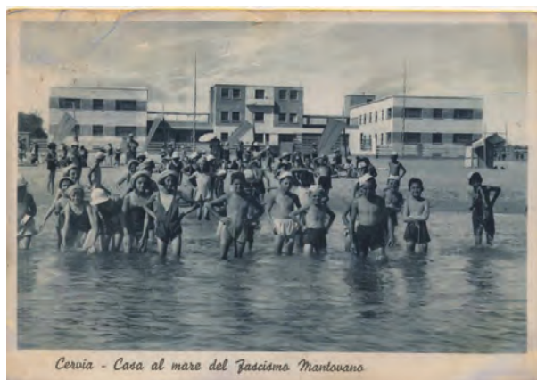
Figura 1. Colonia sulla spiaggia di Cervia negli anni 30 del XX secolo

Attraverso lo studio di due casi, diversi fra loro ma entrambi gestiti fin dall'origine da famiglie autoctone, emerge chiaramente come la spiaggia si sia potenziata molto in strutture, accoglienza e servizi. Alcuni insistono poi sui prodotti "storici" e sul target familiare, altri aprono invece a nuovi clienti e servizi (specializzandosi ad esempio in turismo sportivo, tramite l'allestimento di un piccolo villaggio sulla spiaggia). In ogni caso è l'esperienza maturata dalle famiglie degli imprenditori locali, e trasmessa di padre in figlio, il tratto distintivo e qualificante di un modello turistico che, comunque, sembra in equilibrio con il proprio territorio. A questo fa da supporto una rete imprenditoriale molto solida: nello specifico la Cooperativa Bagnini, a cui aderiscono tutti i 196 gestori dei 106 stabilimenti nelle località studiate.