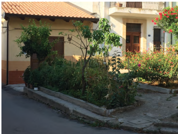
Figura 1. Spazi pubblici ribelli. Orto urbano a Bova Marina (RC)

È bene, a ogni modo, evidenziare che parallelamente all'istituzionalizzazione delle iniziative emerge ancora un'altra sfaccettatura del carattere conflittuale degli orti urbani. Anche a livello internazionale, essi iniziano a essere ricompresi tra i cosiddetti spazi pubblici ribelli, ossia quelli per cui individui e gruppi esprimono relazioni sociali e spaziali alternative, sfidando le pratiche convenzionali su come le aree urbane vengono definite, utilizzate e trasformate. Per restituire appieno la dimensione del conflitto, nel lessico comune, si fa ricorso al termine guerriglia gardening . Tale opzione progettuale trova argomentazione in una particolare visione della cittadinanza ancorata all'impegno attivo della società civile che, a partire da Holston (1995), viene definita insorgente. Una visione operante dei rapporti fra spazio e cittadinanza che, in seguito, Sandercock (1999) precisa riguardo al concetto di pratiche di pianificazione.