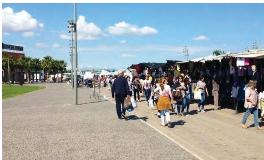
Figura 4. Foggia: il mercato del venerdì in via Miranda

Situazione piuttosto differente per quanto riguarda Foggia, dove l'irrisolta diatriba città/campagna continua a governare le relazioni comunicative tra gli abitanti e a incidere sulla possibilità di ampliamento e allargamento dello spazio pubblico. La sorte di questo mercato è stata fortemente compromessa dopo il trasferimento cinque anni fa dal piazzale antistante lo Stadio Zaccheria in un'area assolutamente priva di servizi nell'estrema periferia est (via Miranda) (Figura 4). La città ha vissuto questo spostamento come una deportazione e, anche in ragione della distanza dal centro abitato e della obiettiva assenza di linee di collegamento pubblico, ha cominciato a disertare questo mercato. L'inidoneità di questa nuova localizzazione ne ha ridotto l'estensione ma, di contro, ha prodotto l'incremento delle bancarelle nel mercato rionale ortofrutticolo di via Rosati, nel pieno centro di Foggia, che, alla luce dell'assolvimento di questa funzione di supplenza, ha scongiurato il pericolo di un suo trasferimento in altra sede.