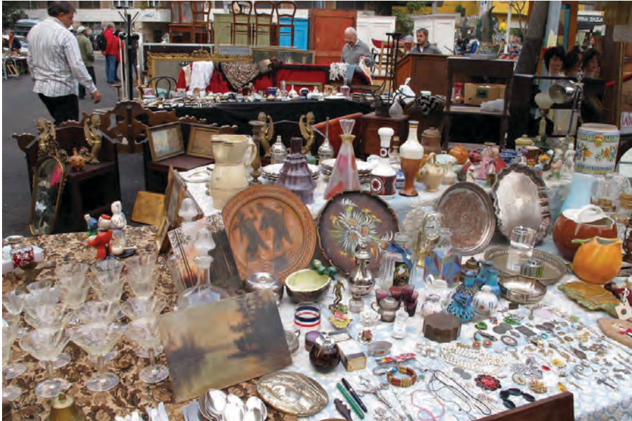
Figura 6. Roma: ingresso al mercato domenicale di Porta Portese dalla via Ippolito Nievo

Il successo di questo storico mercato settimanale è dovuto alla capacità di comporre e ricomporre geografie e biografie, sia umane che sociali. La sua enorme estensione e l'indiscussa popolarità tra residenti e turisti possono fornire validi suggerimenti per intervenire su squilibri di natura economica, sociale e culturale che impediscono allo spazio pubblico di essere percepito e, soprattutto, praticato (Figura 6).