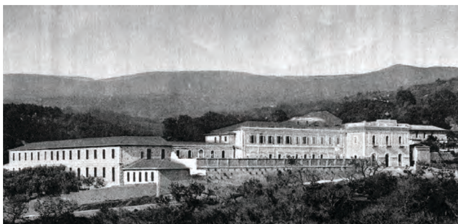
Figura 2. Ospedale psichiatrico di Catanzaro in Girifalco: veduta