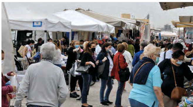
Figura 1. Bari: mercato settimanale del lunedì in zona Fiera del Levante