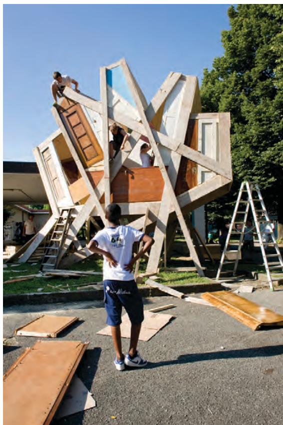
Figura 2. Raumlabor, Cantiere Barca, Torino, 2012

Tra queste, l'installazione abitabile Star House è divenuta un «vero e proprio landmark capace di interpretare il diffuso desiderio di identità e di attenzione del territorio», trasformandosi «per molti nel simbolo di un quartiere che si proponeva sotto l'inedita veste di officina creativa» (Comisso e Perlo 2018: 22). La collaborazione di soggetti quali il Goethe-Institut Turin e la Circoscrizione 6 della Città di Torino, e il sostegno economico dato da istituzioni e soggetti privati – Compagnia di San Paolo, Città di Torino, Regione Piemonte, Impresa Rosso S.p.A., Viglietta Matteo S.p.A. – evidenzia l'ampia condivisione del progetto, sostenuto anche da Fondation de France, fino ad allora impegnata solo in azioni sul territorio francese.