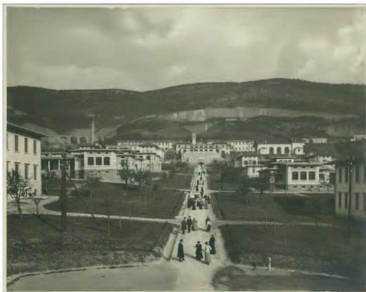
Figura 3. M. Strobl, Ospedale San Giovanni di Trieste: padiglioni e viale centrale, 1910

Il progetto, realizzato in modo abbastanza fedele, propone quindi un compromesso tra l'impostazione centralizzata, cui rinvia l'asse spinale su cui sono collocati gli edifici direzionali e comuni, e quella a padiglioni sparsi. Vi è poi un secondo compromesso. Immersa nel verde, con ampi scorci panoramici sulla città e il golfo (il teatro, per esempio, ha una parete di fondo che può essere aperta al paesaggio) e con un'articolazione tale da invitare a un movimento fluido tra aree e edifici, la struttura si ispira esplicitamente all'idea di open door . Contrariamente alle prime idee progettuali essa, tuttavia, non rinuncia a una cinta muraria, cui ben presto si aggiungono recinzioni interne, tra i vari padiglioni, parse necessarie a seguito di episodi di fuga di pazienti. Più radicale o coerente, da questo punto di vista, è il non lontano e coevo (fu inaugurato nel 1904) manicomio di Udine: simile a quello triestino per l'essere imperniato su padiglioni separati, immersi nel verde, suddivisi in sezioni maschili e femminili e distribuiti in base allo stato clinico dei pazienti, ma corredato di una colonia agricola e soprattutto il primo in Italia a fare a meno di mura perimetrali di contenimento, sostituite da una cancellata continua (www.architetture manicomiali).