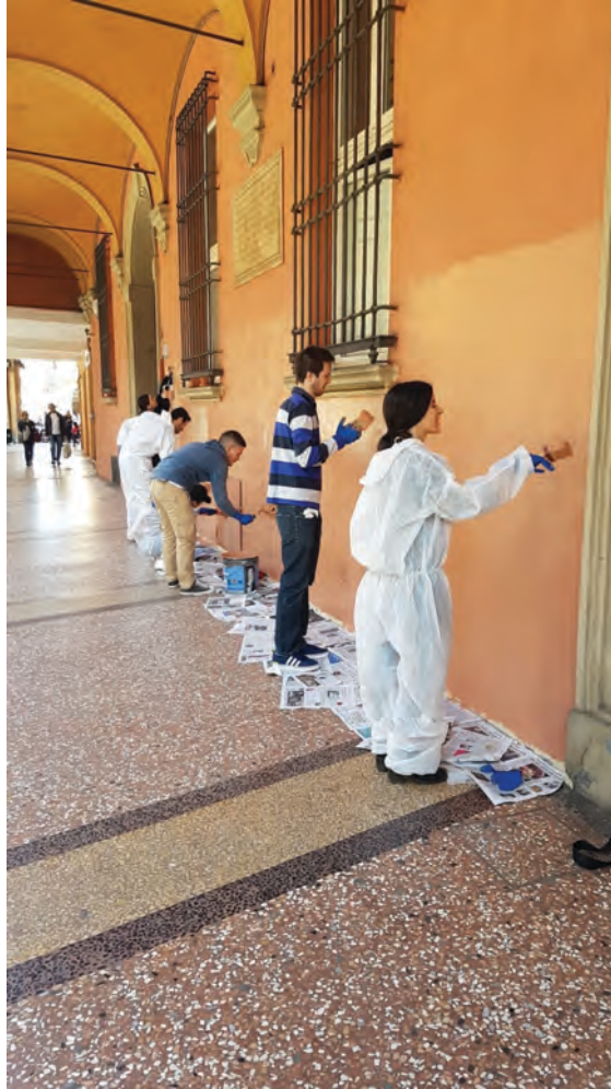
Figura 4 – Bologna. Un gruppo di giovani del RotarAct Club mentre ridipingono i portici del quartiere Santo Stefano

pulizia delle pavimentazioni e dei muri delle arcate, anche allo scopo di organizzare proiezioni di film, piccoli eventi musicali ed attività culturali.