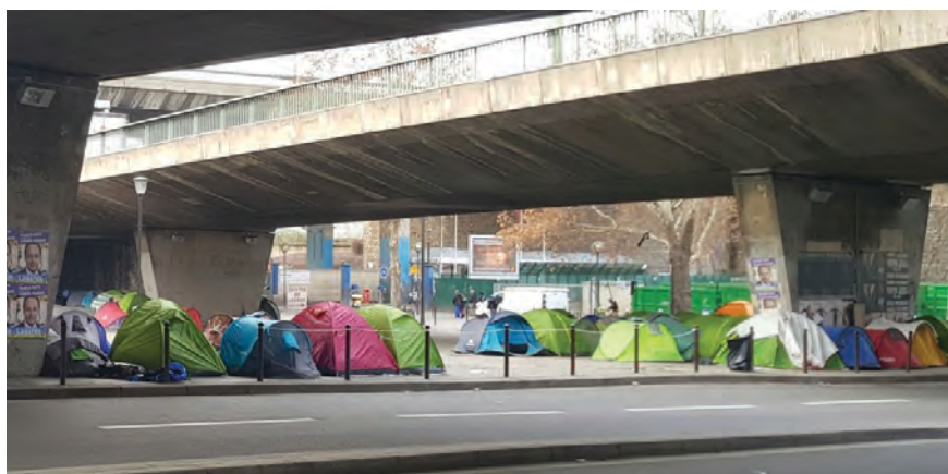
Figura 2 – Parigi: decine di tende riunite sotto un ponte stradale a Port de la Chapelle a Parigi (2019)

Da almeno cinque anni, comunque, per residenti e turisti il paesaggio parigino è cambiato, soprattutto durante le stagioni più fredde, popolandosi di aree campeggio anche in alcune delle sue zone più prestigiose e conosciute, come lungo il Canal Saint Martin. Mentre qualcuno chiede provocatoriamente se Parigi è diventata la nuova Calais (Nossiter 2016), e la polizia assicura, a quattro anni di distanza da quella provocazione, «che non si avvieranno nuovi cicli di evacuazione e reinsediamento senza fine» (Infomigrants 2020), decine di importanti organizzazioni – non governative e di orientamento diverso - accusano compatte lo stato di mettere deliberatamente in pericolo i migranti, costringendoli essenzialmente a diventare quasi invisibili.