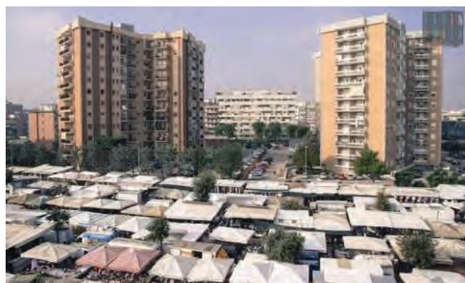
Figura 2. Bari: mercato settimanale del giovedì zona via Salvemini – Guido D'Orso (Fonte: Barinedita, 24 ottobre 2017)