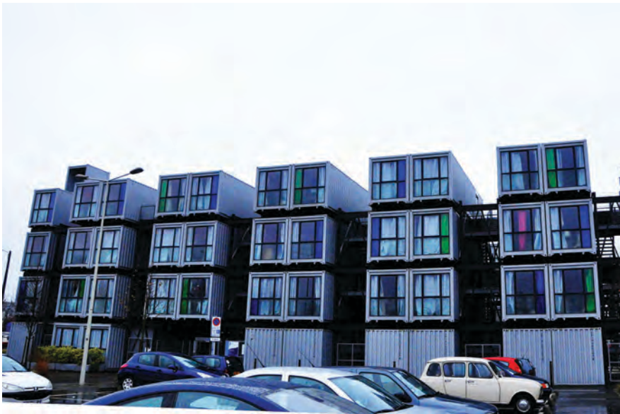
Figura 2. La Cité a'Docks di Le Havre

Nonostante le significative differenze tipologiche, possiamo comunque individuare elementi comuni. Da un lato, fino a tempi relativamente recenti, buona parte delle strutture si basa su un modello “monastico”; dalle prime residenze per clerici vagantes medievali (che del resto spesso erano membri di ordini minori) fino al Pavillon Suisse di Le Corbusier, che – come ben dimostra Leatherbarrow (2017) – si basa sull'idea dello “studente-monaco”. Una cella, ascetica, che nel Novecento incontra la standardizzazione produttiva modulare, che continua ancora in interventi recenti, come nel caso della residenza per studenti Zuiderzeeweg ad Amsterdam (peraltro, isolata e marginale nel tessuto urbano, non certo una soluzione particolarmente gradevole) o – ancor più d'impatto – nel caso della Cité a'Docks a Le Havre (Fig. 2), in cui la riqualificazione dell'area portuale passa anche per la costruzione di uno studentato fatto con container in disuso.