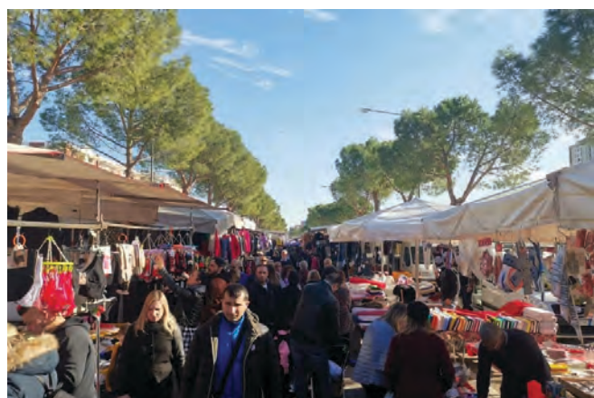
Figura 3. Bari: mercato settimanale del sabato zona Poggiofranco