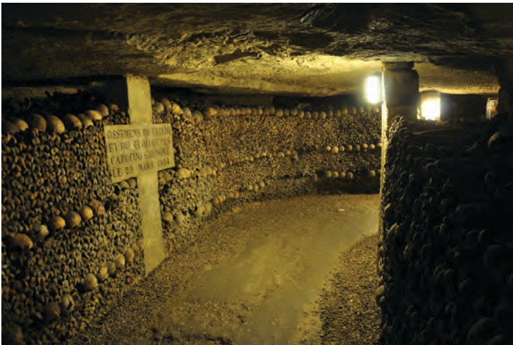
Figura 1. Catacombe di Parigi

La pratica di seppellire i propri morti a scopo di conservazione o commemorazione esiste fin dall'era preistorica e segna l'inizio della civilizzazione e di altre pratiche culturali e religiose dell' homo sapiens (Ragon 1981). Primi esempi sono i campi tombali ( grave fields ), luoghi dove venivano riposti i defunti assieme agli oggetti a loro appartenuti, evolutisi nelle necropoli che prevedevano stanze separate per ogni morto fino a costituire una vera e propria città a sé o nelle catacombe, sviluppate su più livelli di profondità. Specialmente in Europa, dall'età del bronzo, convissero diverse pratiche, come la tumulazione o la cremazione del corpo. A partire dal VII sec. d.C., in Europa, le sepolture erano sotto il controllo della Chiesa in luoghi consacrati e, dopo anni, le ossa riesumate venivano sistemate negli ossari. La crescita demografica, l'espansione delle città che inglobavano le periferie dove erano ospitati i cimiteri, gli spazi ristretti delle chiese, la diffusione di malattie dovute alla vicinanza dei campisanti obbligarono i legislatori a creare nuovi cimiteri lontano dai centri urbani. L'editto napoleonico di Saint-Cloud del 12 giugno 1804 – applicato anche in Italia – prevedeva il divieto di seppellire i defunti in città e, nella sola Parigi, portò allo spostamento nelle catacombe di circa sei milioni di resti da tutti gli ossari e chiese.