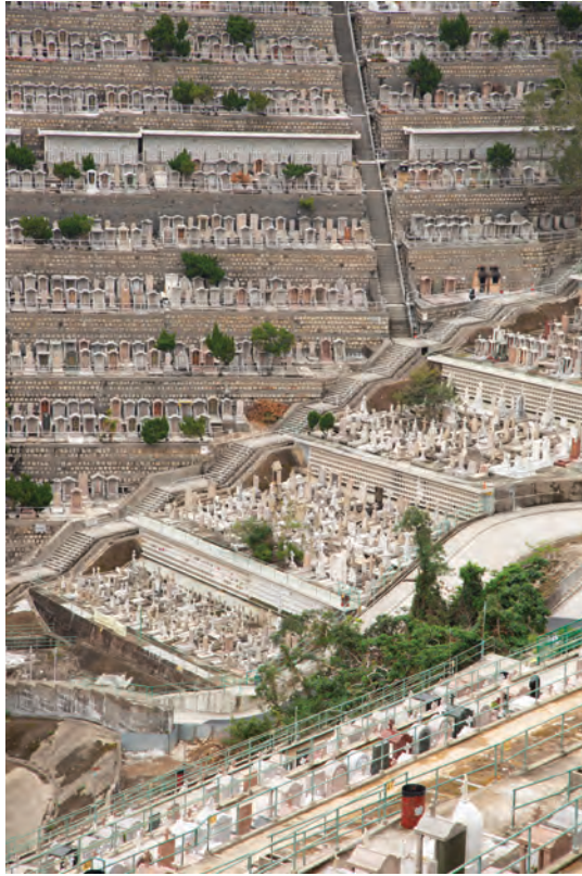
Figura 2. Cimitero verticale di Hong Kong

importanti della famiglia, ai loro parenti diretti e servi, ai liberti e parenti lontani. Non interrati ma lanciati verso il cielo sono i c.d. cimiteri verticali, come quelli sulla collina a Hong Kong o il Memorial Necropole Ecumenica a Santos, in Brasile: un grattacielo di oltre cento metri di altezza in grado di ospitare 25mila loculi, cripte, cappelle, sale di veglia e spazi per rilassarsi.