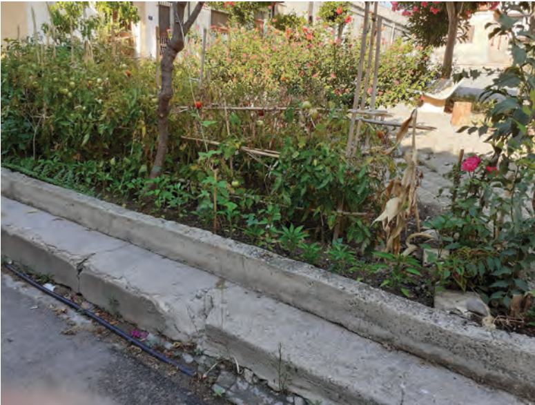
Figura 2. Orto urbano a Bova Marina (particolare)

virtuosi processi d'interazione progettuale e sedimentando la consapevolezza di un valore altro del suolo, del cibo, del lavoro. In altri termini, gli orti urbani come beni comuni agricoli (Donadieu 2017). Com'è noto, l'attivazione di tali beni travalica il suo contenuto materiale poiché tende alla definizione di un diverso immaginario alternativo a quello, inesorabilmente orientato dalla proprietà e dal mercato, che ha messo in crisi tanto la terra quanto i valori civili (Consonni 2016, Caridi 2017). Una prospettiva valida anche da un punto di vista comunicativo, poiché richiama visioni ampiamente sedimentate nella cultura sociale. Visioni oggi oscurate, ma non espunte; il riferimento alla terra, tanto nella sua materialità quanto nella sua capacità evocativa, può costituire un potente collante ideologico e fattuale per le variegate pulsioni che si esprimono sul territorio.